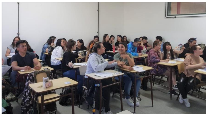
Cynrychiolwyr rhyngwladol yn y wers Gymraeg ym mis Medi 2019