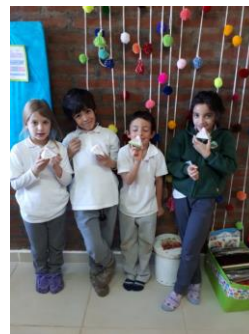
Sesiwn celf gyda phlant BI 2 Ysgol y Cwm

Dathlu Parti Piws mwyaf y byd. Dewin a Doti – cymeriadau Mudiad Meithrin yn troi yn 10.