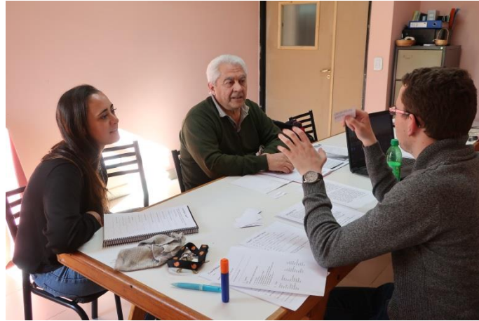
Dosbarth Oedolion yn y Ganolfan yn Esquel

Mae hwn yn ffordd effeithiol a difyr i orffen y dosbarth ac maen nhw'n dysgu geirfa newydd heb feddwl. Mae aelodau'r dosbarth yn dangos brwdfrydedd i ddysgu'r Gymraeg ac yn mwynhau eu gwersi a bod yn rhan o'r diwylliant Cymreig.