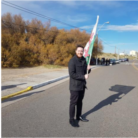
Cario'r faner ym Madryn