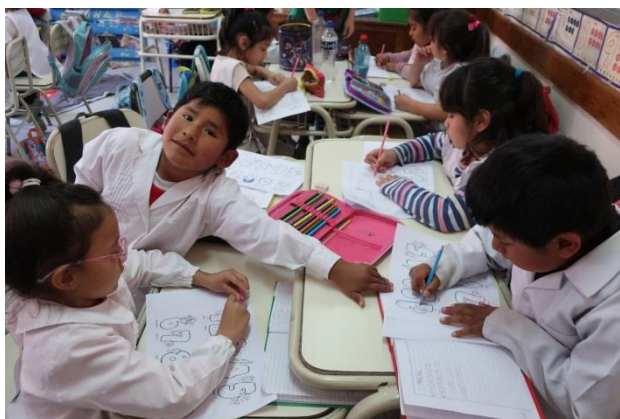
Dosbarth Cymraeg yn Ysgol Bryn Gwyn, Dyffryn Camwy

Buom mewn sefyllfa freintiedig eleni o allu penodi Swyddog Datblygu Menter llawn amser, a fyddai'n cysegru'r holl amser i gymdeithasoli iaith ar draws y dalaith. Roedd hyn yn golygu y byddai'r ddau Swyddog Datblygu arall yn gallu canolbwyntio'n gyfan gwbl ar y dysgu. Mae creu cyd-destun i'r iaith tu allan i'r ystafell ddosbarth yn allweddol bwysig yn y Wladfa gan na chlywir y Gymraeg ar y radio na'r teledu bellach. Nid oes chwaith unrhyw bapur newydd Cymraeg yn cael ei argraffu'n rheolaidd. I bob pwrpas felly, mae'r iaith yn hollol anweledig yn y cymunedau a chan nad yw'r iaith yn brif gyfrwng cyfathrebu, mae taer angen paratoi gweithgareddau cymdeithasol trwy gyfrwng y Gymraeg i greu cyfleoedd i ddefnyddio'r iaith yn gymdeithasol. Fel y gwelir oddi wrth adroddiad Sinead Harris y Swyddog Menter eleni, croesawyd yr arbrawf yma gan nifer fawr o'r trigolion yn y Wladfa eleni a'r gobaith yw bod yr ymgais arloesol yma wedi gosod seiliau cadarn ar gyfer y math yma o waith yn y dyfodol.