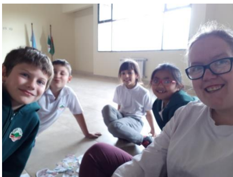
Gyda plant Blwyddyn 3 Ysgol y Cwm