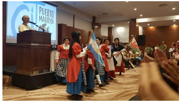
Dawnswyr Cymdeithas Gymraeg Porth Madryn yn y Gynhadledd Ryngwladol i weithwyr ym maes Twristiaeth