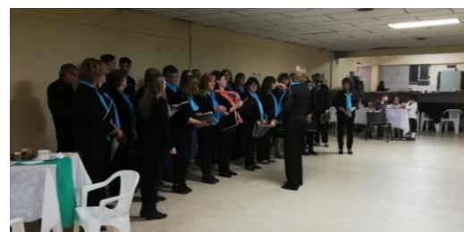
Cyngerdd yn y Gaiman