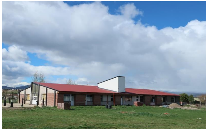
Adeilad Ysgol y Cwm, Trevelin