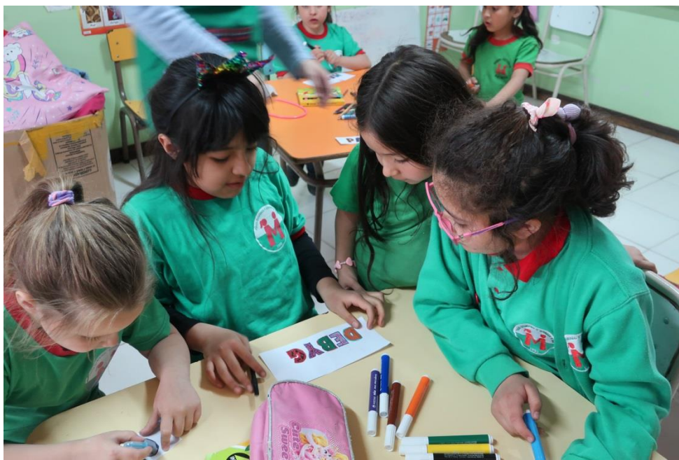
Rhai o ddisgyblion Ysgol Gymraeg y Gaiman

Yr ydym ni, fel y ddwy ysgol ddwyieithog arall yn nhalaith Chubut, yn credu y byddai'n fuddiol iawn petai'r Cynllun Dysgu Cymraeg yn y Wladfa yn medru gyrru athrawon cynradd Cymraeg cymwysedig i weithio'n benodol yn ein hysgolion dwyieithog. Mae presenoldeb athrawon di-Sbaeneg yn hanfodol i lwyddiant ein hysgolion, fel y gwyddom o brofiad.