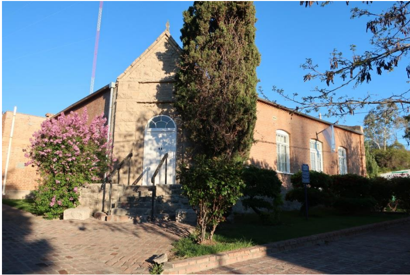
Coleg Camwy, y Gaiman

Sefydlwyd Coleg Camwy fel 'Ysgol Ganolraddol' yn 1906 a hi oedd yr ysgol uwchradd gyntaf yn y Wladfa. Y gred gyffredinol yw mai hi oedd yr ysgol uwchradd Gymraeg gyntaf i'w sefydlu yn y byd.