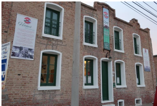
Canolfan Toschke, Porth Madryn