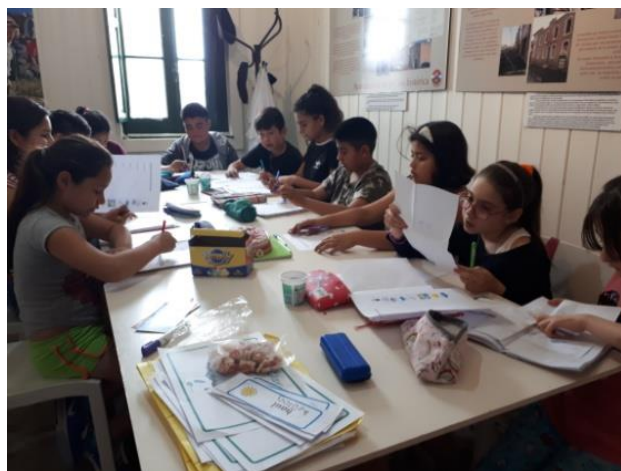
Dosbarth Plant Porth Madryn

Mae'r clwb yma yn digwydd ar nosweithiau Gwener yn safle ysgol yr Hendre .Mae'r rhai sydd wedi bod yn mynychu yn gyson eleni i gyd yn gyn disgyblion ysgol yr Hendre ond maen nhw bellach mewn ysgolion uwchradd Sbaeneg. Mae'n hanfodol felly bod y cyfle yma iddynt ymarfer eu Cymraeg yn bodoli. Rydym wedi gwneud nifer o bethau amrywiol yn cynnwys cwis, sialensiau gwahanol, gemau cardiau amrywiol a hefyd maen nhw wedi dysgu fi sut i chwarae gêm dis o'r Ariannin.