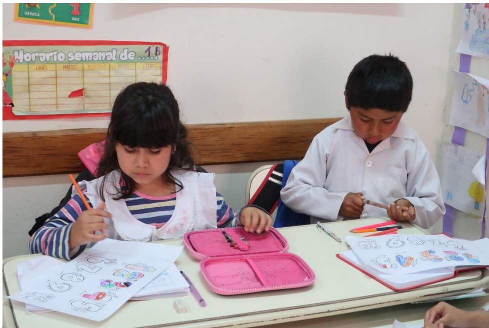
Rhai o ddisgyblion Ysgol Bryn Gwyn