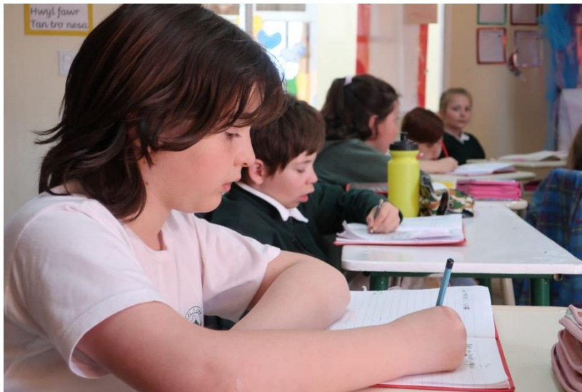
Rhai o ddisgyblion Ysgol y Cwm