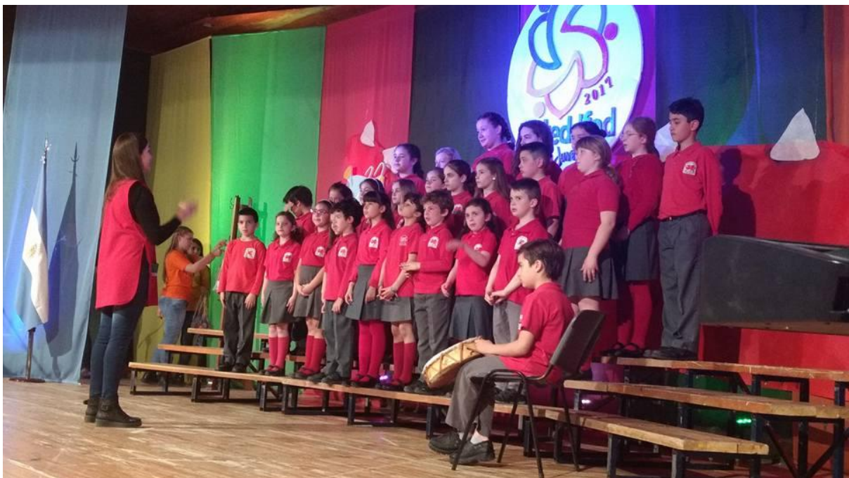
Rhai o blant yr Hendre yn cystadlu yn Eisteddfod yr Ifanc 2017