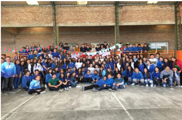
Gyda myfyrwyr Coleg Camwy

Fe gawson nhw brofiad arbennig yn dawnsio ac yn ymarfer y Gymraeg gyda disgyblion y Coleg. Yna aethant ar daith o gwmpas y Gaiman gyda rhai o ddisgyblion y drydedd, y bumed a'r chweched flwyddyn yn eu tywys nhw o gwmpas gan roi hanes adeiladau'r Gaiman iddynt. Y noswaith honno, fe ddiddanwyd trigolion Dolavon yn y Ganolfan Fasnachol gydag amryw o eitemau cerddorol a llafar.