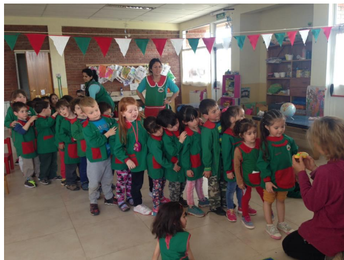
Rhai o ddisgyblion ac athrawon Ysgol y Cwm

Y syniad yw bod y ddwy iaith yn cyd-fyw'n naturiol o fewn yr ysgol a bod yr athrawon sydd yn gallu siarad Cymraeg yn gwneud hynny'n gyson gyda'r plant.