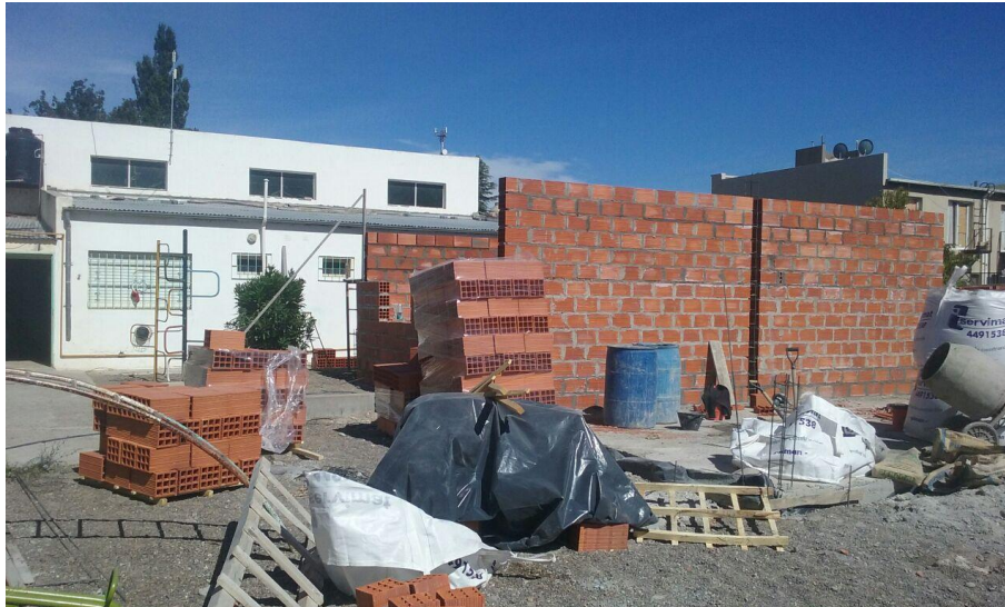
Adeiladu dwy ystafell ddosbarth newydd yn Ysgol Gymraeg y Gaiman