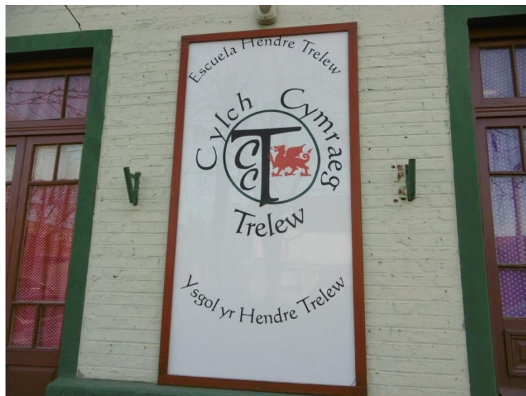
Adeilad gwreiddiol Ysgol yr Hendre yn ardal Moreno, Trelew

Agorwyd Ysgol yr Hendre yn Nhrelew gyda 22 disgybl ar Fawrth y 6ed 2006. Bellach mae ganddi 104 o ddisgyblion, ac maent yn derbyn 3 awr a hanner o addysg trwy gyfrwng y Gymraeg yn ddyddiol mewn dau adeilad yn y dre.