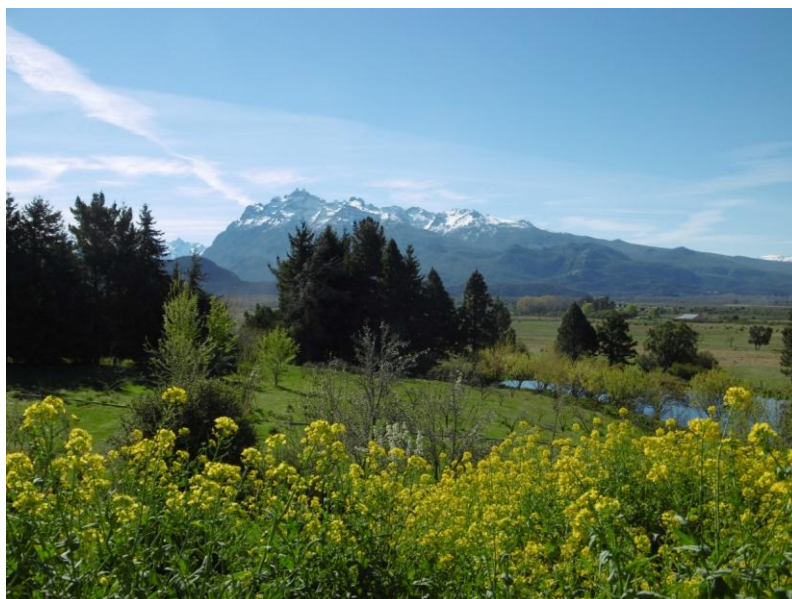
Golygfeydd hyfryd ardal yr Andes

Pwysleisio pwysigrwydd o barhau i ddatblygu a chryfhau'r ddarpariaeth bwysig yma ym mhob cymuned fel rhan o broses normaleiddio'r iaith yn nhalaith Chubut.