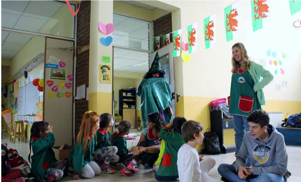
Ysgol y Cwm

Sgiliau siarad. Holi ac ateb cwestiynau. Criw gwych sy'n cael llawer o hwyl. Dysgu'n gyflym iawn ac yn cofio llawer. Hoff iawn o ganu pop Cymraeg.