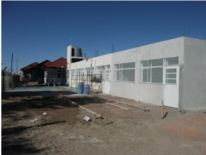
Gwaith adeiladu'r ystafelloedd dosbarth newydd yn Ysgol yr Hendre

Oherwydd y cynnydd cyson, mae'r ysgol yn y broses o adeiladu dwy ystafell ddosbarth ychwanegol a fydd yn neilltuo ystafell ddosbarth ar gyfer pob oedran ar draws yr ysgol am y tro cyntaf.