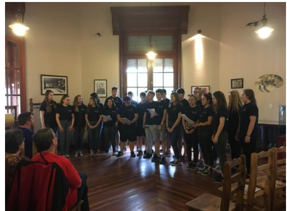
Perfformio yng nghyngerdd Dolavon