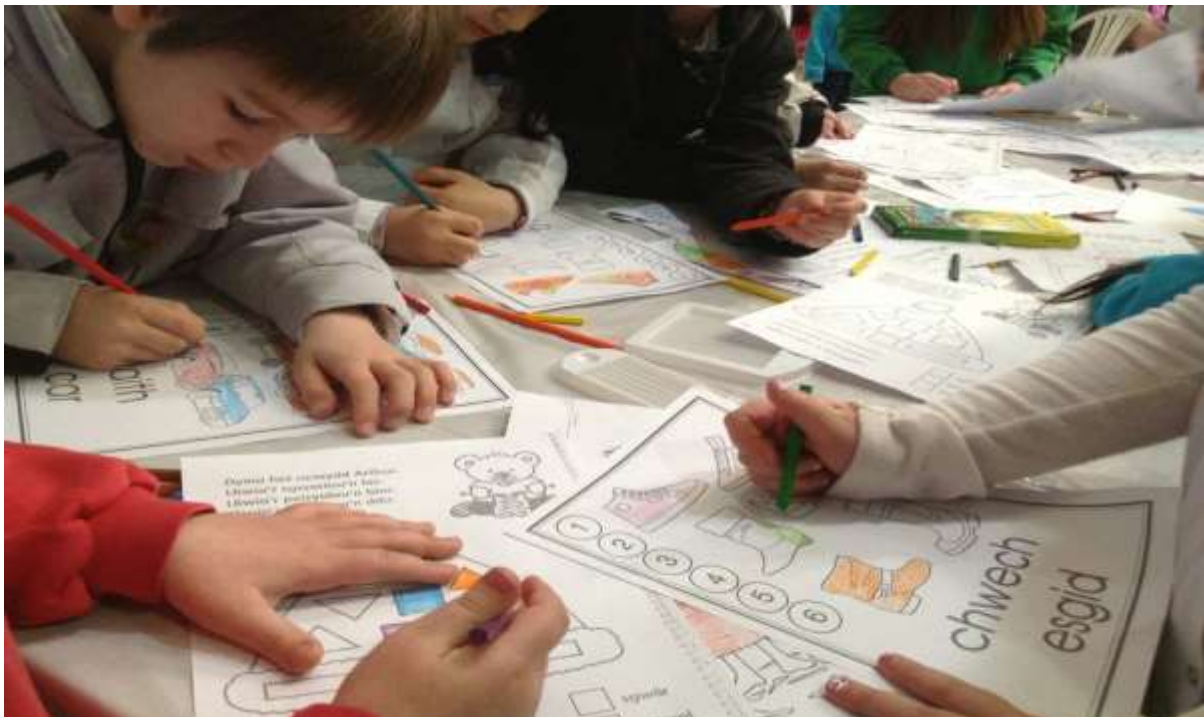
Eisteddfod Yr Ifainc, Gaiman